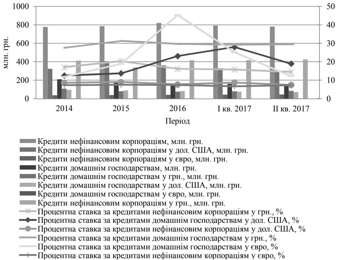
Рис. 2. Динаміка процентних ставок та обсягів банківського кредитування реального сектору економіки протягом 2014 р. – II кв. 2017 р.