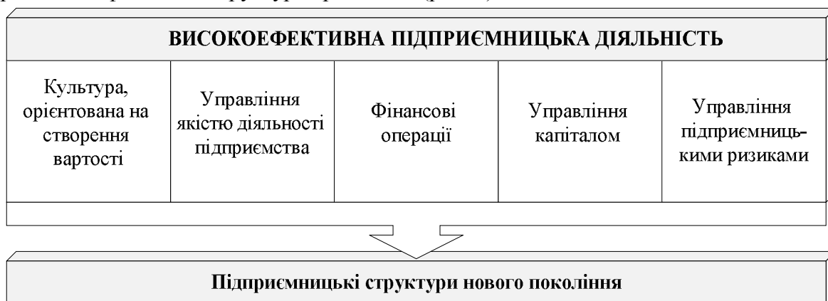
Рис. 2. Організація високоефективної фінансової діяльності

У процесі виконання фінансової роботи виникає сукупність конфліктів і проблем, що потребують негайного вирішення і можуть спричинити ланцюгову реакцію, здатну призвести до втрати доходів (прибутків, капіталу). Зокрема, за дослідженнями М. Саткліфа та М. Доннеллана, більшість підприємств у своїй діяльності мають конфлікт у двох сферах [10]. А отже, на їх думку, значна увага повинна приділятися керівництву і стратегії, при цьому одночасно зосереджуватися увага на базових функціях фінансової діяльності і бухгалтерського обліку. Їхні дослідження на базі Accenture (консалтингової компанії, що надавала послуги організаціям щодо консультивання у сферах стратегічного планування, оптимізації й організації аутсорсинга бізнес-процесів, управління взаємозв'язків з клієнтами, менеджменту персоналу, запровадження інформаційних технологій, управління логістикою тощо) дали змогу виділити такі п'ять ключових фінансових здібностей, які позитивно впливають на якість діяльності підприємства і можуть бути представлені у вигляді стовпців (колон), на яких тримається фінансова структура організації (рис. 2).