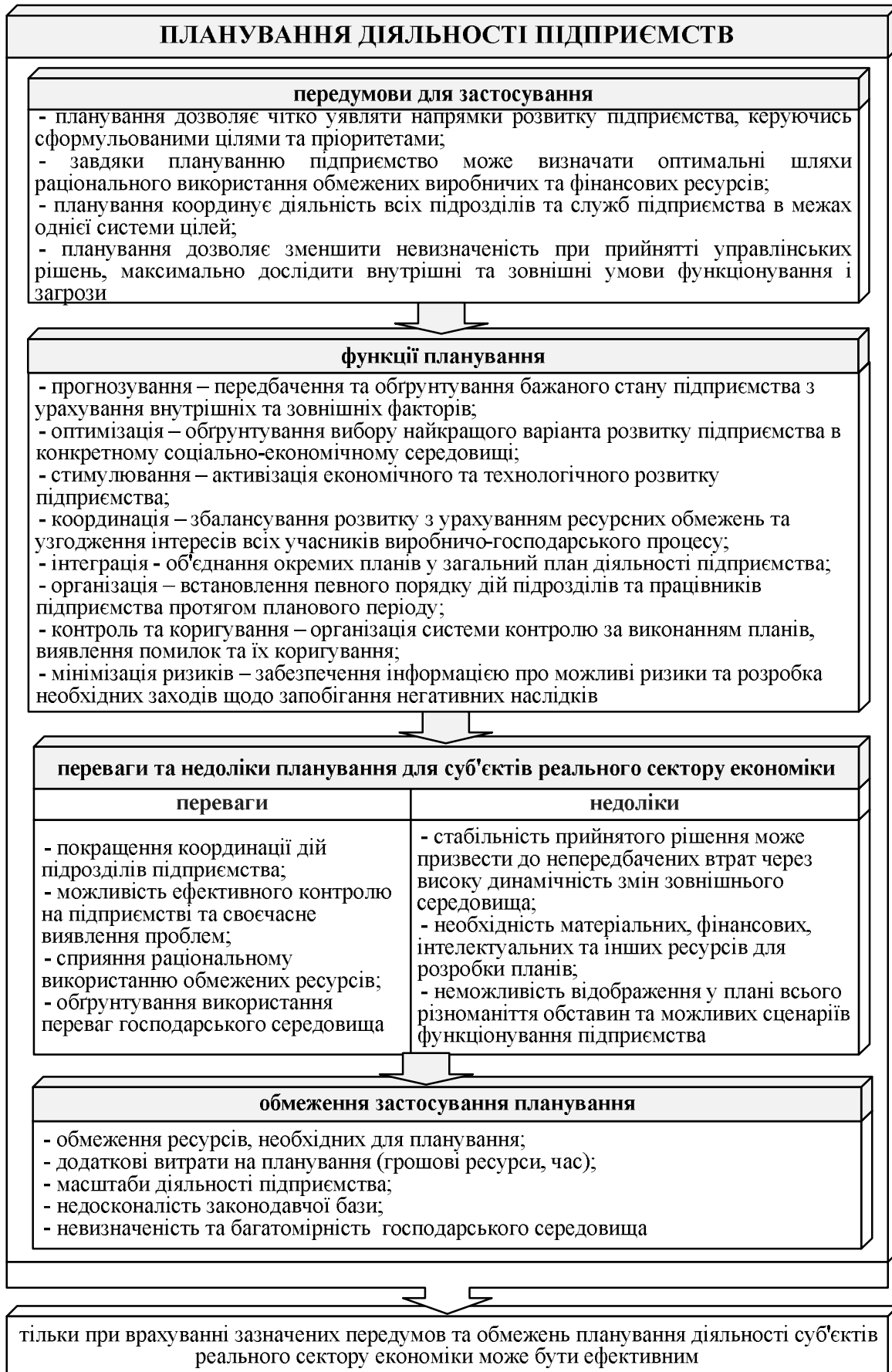
Рис. 2. Теоретичні засади дослідження планування діяльності підприємств як наукової категорії