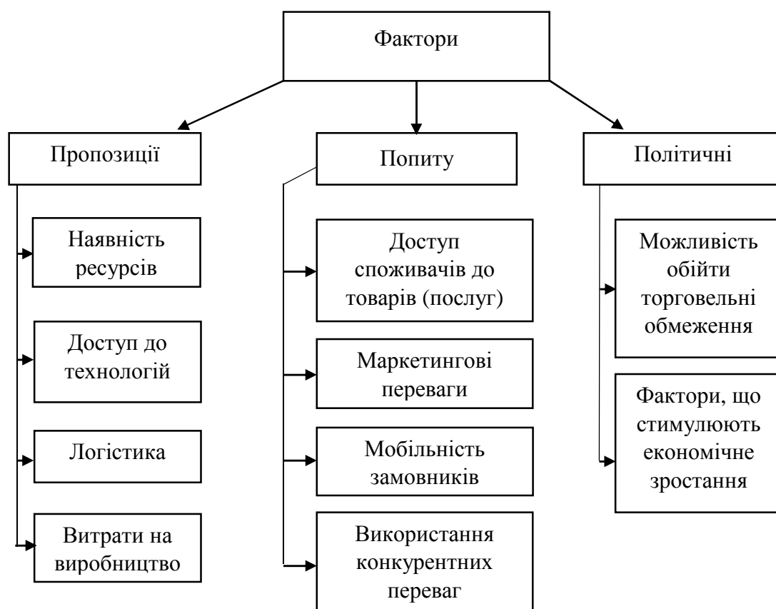
Рис. Фактори, що впливають на ухвалення рішень стосовно прямих іноземних інвестицій

Бурхливий розвиток світової економіки, її складність та багаторівневість створює широкі перспективи для розвитку компаній. Коли всередині країни їм стає тісно, то приймається рішення про вихід на міжнародні ринки. Для цього використовують пряме інвестування капіталу в іноземні активи. Цей процес супроводжується аналізом усіх факторів впливу та ретельним дослідженням кожного з них. О. В. Шкурупій виділяє три категорії факторів, що впливають на рішення про використання прямих іноземних інвестицій. Більш детальну класифікацію представлено на рис. 1 [7].