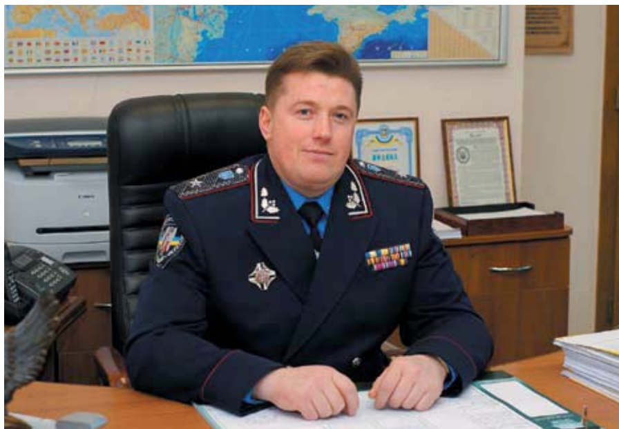
Сергій БУДНІК, начальник Центру безпеки дорожнього руху при ДДАІ МВС України, генерал-майор