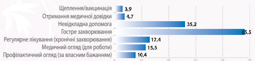
Рис. 3. ОСНОВНІ ПРИЧИНИ ЗВЕРНЕНЬ ДО МЕДИЧНИХ ЗАКЛАДІВ, %

Більшість особистих фінансових витрат громадян у закладах охорони здоров'я України сьогодні перебувають у площині тіньової економіки, є неофіційними, а отже, не супроводжуються гарантіями якості наданих послуг та належної відповідальності за порушення прав пацієнтів. Перевага страхової ме-