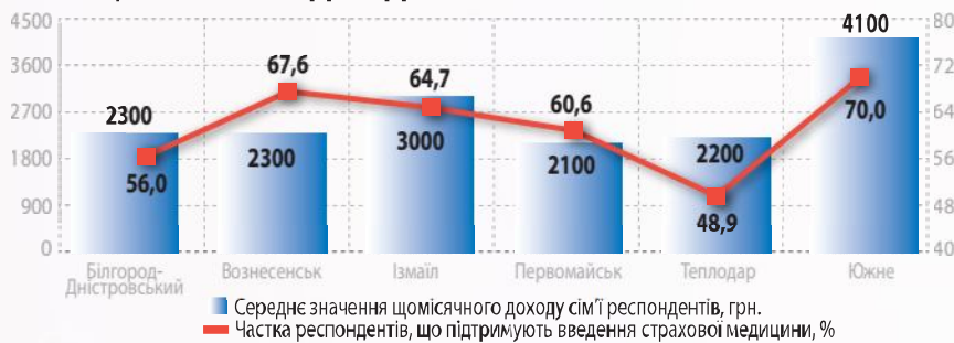
Рис. 6. ЧАСТКА РЕСПОНДЕНТІВ, ЩО ПІДТРИМУЮТЬ ВВЕДЕННЯ СТРАХОВОЇ МЕДИЦИНИ, ТА СЕРЕДНЬЄ ЗНАЧЕННЯ ЩОМІСЯЧНОГО ДОХОДУ ЇХНІХ СІМЕЙ

вої медицини може спіткати такі перешкоди: