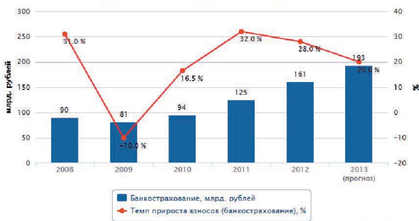
Динамика рынка банкострахования

Новым импульсом развития рынка банкострахования в 2013-2014 гг. станет накопительное и инвестиционное страхование жизни, которое невозможно навязать. Здесь необходимы особые технологии продаж, которыми обладают классические страховщики жизни. Лишь крайне небольшое число крупнейших банков смогут развить это направление силами собственных страховых компаний.