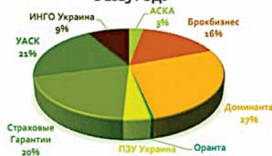
ДАННЫЕ ПО СУММАМ ПРЕМИЙ В 2013 ГОДУ