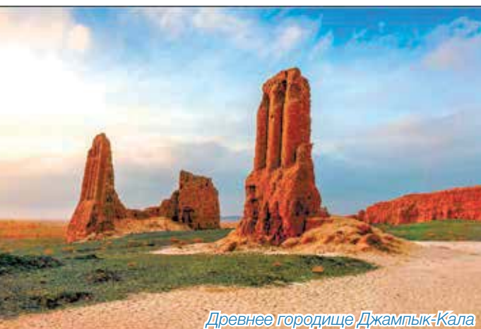
Древнее городище Джампък-Кала

Крепость расположена в 27 км к северу от города Бируни. Крепость стоит на равнине и имеет форму, почти близкую квадрату, размерами 65x63 м. Ориентирована углами по сторонам света. Внешняя стена