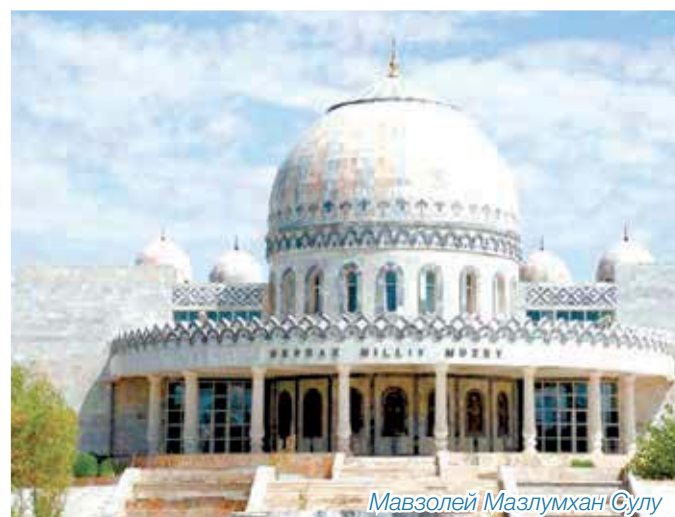
Мавзолей Мазлумхан Сулу

была прорезана двумя ярусами стреловидных бойниц. Была возведена, вероятно, как оборонительная крепость и входила в цепь хорезмийских укреплений, созданных государством для защиты северо-восточного рубежа античного Хорезма. Одновременно крепость была центром сельскохозяйственной округи и узлом караванных дорог через горный хребет Султануиздаг.