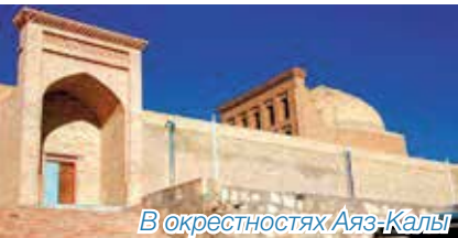
В окрестностях Аяз-Калы