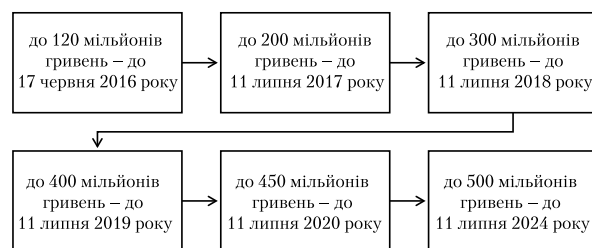
Рис. 1. Графік нарощення статутного капіталу банків України до липня 2024 р.

На сучасному етапі, згідно з Законом України «Про спрощення процедур реорганізації та капіталізації банків» від 23.03.2017 та Постановою №58 «Про збільшення капіталу банків України» від 4 лютого 2016 року, НБУ зобов'язав банки поетапно збільшити капітал до 500 млн гривень – до 11 липня 2024 року (рис.1). Основним макроекономічним фактором, що спричинив зміни вимог до статутного капіталу, стала криза 2014–2015 рр. та підписання Угоди про асоціацію України з ЄС [6].