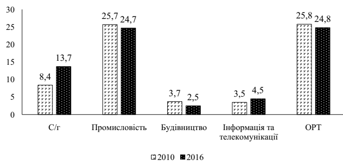
Рис. 1. Динаміка структури валової доданої вартості за видами економічної діяльності за період 2010-2016 рр., % Джерело: Побудовано за: [3]

За 2016 р. індекс промислової продукції становив +2,8% на тлі падіння у попередні чотири роки, а в січні-вересні 2017 р. спад промисловості становив 0,3% проти аналогічних дев'яти місяців 2016 р. За попередніми оцінками, в 2016 р. внесок переробної промисловості у структуру промислового виробництва залишився на рівні попереднього року. Ситуація виглядає ще більш критичною через неефективну структуру промислового виробництва, що збільшує вразливість багатьох галузей до викликів та обмежень на зовнішньому та внутрішньому ринках. Частка промисловості в структурі валової доданої вартості (ВДВ) постійно знижується і в 2016 р. становила 24,7% проти 25,7% у 2010 р. та 31,2% у 2007 р. (рис. 1). За підсумками 2016 р. обсяги реалізованої продукції машинобудування та металургії є меншими, ніж обсяг продукції харчової промисловості.