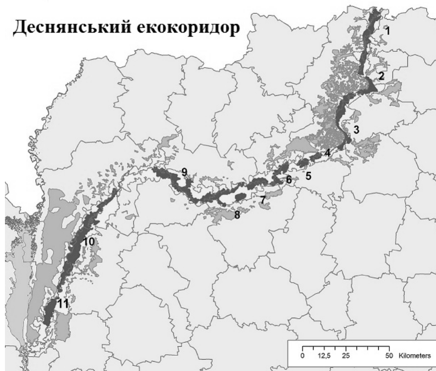
Рис. 2 – Схема Деснянського екокоридору національної екомережі. Ключові території: 1 – Деснянсько-Старогутська, 2 – Коротченківська, 3 – Мезинська, 4 – Оболонська, 5 – Лутавська, 6 – Межиріччя Десни та Сейму, 7 – Межиріччя Десни та Убеді, 8 – Трубинська, 9 – Макошинська, 10 – Деснянська, 11 – Любичівська.