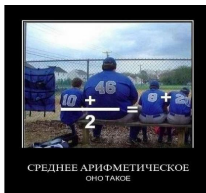
Рис. 4. Математический юмор из Интернета

Количество комментариев – посетители странички высказывают свое мнение и показывают свой интерес и отношение к данному посту. В обучении особенно полезно использование дискуссии, которая записана и любой участник группы в любое время может проследить ее логику. Отдельно сам учитель может дать указания и похвалить школьников. Риски кроются в том, что если поставлена задача, школьники увидят ответы, поставленные предыдущими пользователями и возможно скопируют их. С другой стороны, учитель может учесть только первый правильный ответ. Тут можно организовать и вложенные комментарии, если в ходе основного вопроса появятся интересные темы обсуждения.