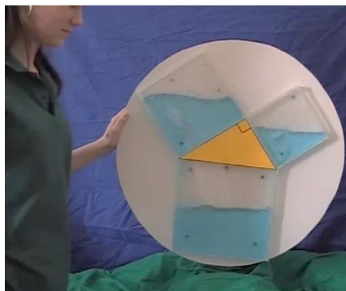
Рис. 3. Наглядная теорема Пифагора

Например, на рис. 3 представлен известный в Интернет-пространстве видеоклип, показывающий наглядно смысл теоремы Пифагора, с помощью переливания. Это видео https://youtu.be/CAkMUdeV06o достаточно популярно и получило немало положительных отзывов.