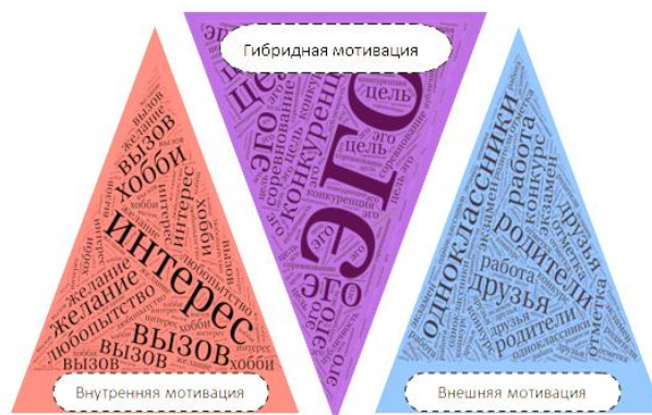
Рис. 1. Виды мотивации

Существует множество исследований и удачных практик в области мотивации в обучении. Чтобы найти самые подходящие инструменты для мотивации, сначала важно выявить какую именно мотивацию учитель будет стимулировать.