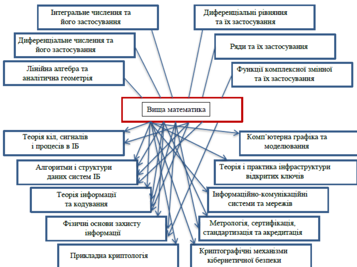
Рис. 1. Схема міжпредметних зв'язків «Вищої математики» з фаховими дисциплінами