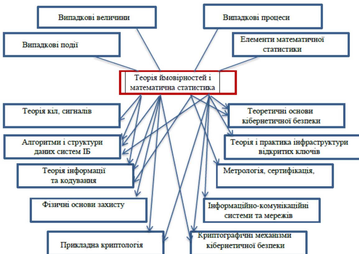
Рис. 2. Схема міжпредметних зв'язків «Теорії ймовірностей і математичної статистики» з фаховими дисциплінами