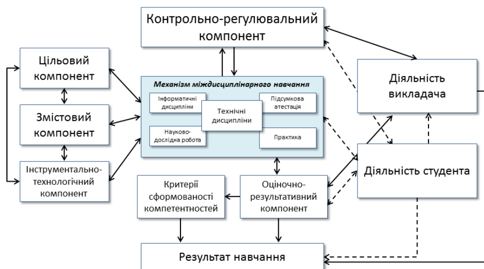
Рис. 2. Модель міжпредметної методики формування технічних компетентностей

методика, як і методика вивчення окремих дисциплін містить всі компоненти організації навчального процесу (рис. 1).