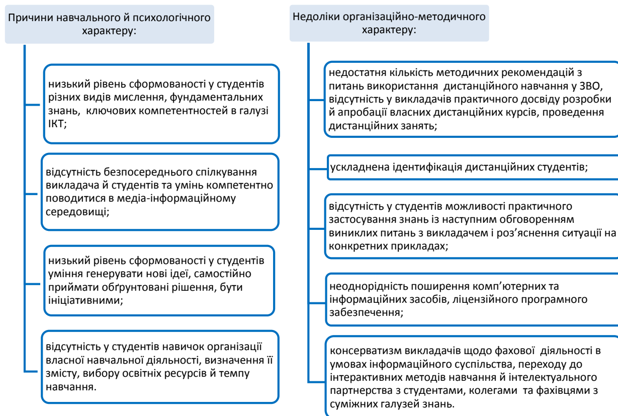
Рис. 2. Негативні чинники масового використання дистанційних курсів у ЗВО

Також актуальними проблемами при підготовці вчителів інформатики з використанням дистанційних курсів є: пошук інноваційних форм і методів навчання, що мотивують студентів цілеспрямовано самостійно навчатись; модернізація матеріально-технічної бази. При цьому основною складовою успішного впровадження у ЗВО елементів дистанційної освіти є вибір платформи навчання та програмного забезпечення. У Рівненському державному гуманітарному університеті (РДГУ), зокрема, на кафедрі інформаційно-комунікаційних технологій та методики викладання інформатики (ІКТ та МВІ), підготовка вчителів інформатики до майбутньої професійної діяльності організована на основі використання віртуального навчального середовища Moodle, дистрибутив якого розповсюджується безкоштовно за принципами ліцензії Open Source [10], і за даними порівняльного аналізу не поступається кращим зразкам комерційних систем такого типу.