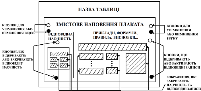
Рис. 1. Модель однорівневого інтерактивного плаката.

Інтерактивні плакати можна класифікувати за формою та змістом. Залежно від об'єму матеріалу обирають одно- або багаторівневу модель побудови інтерактивного плаката. Однорівневий плакат, як правило, є робочою областю з набором різних інтерактивних елементів (ІЕ). Зміст робочої області змінюється залежно від стану інтерактивних елементів (натиснень кнопок, змісту полів введення тексту і т.д.) (рис. 1).