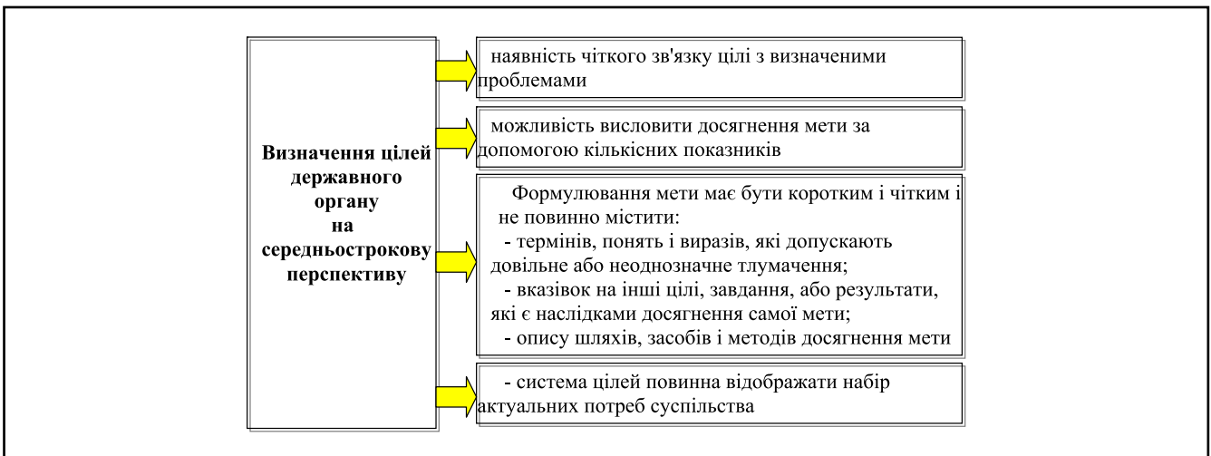
Рисунок 2. Визначення цілей економічного розвитку

У документі має бути наведено відповідність цілей стратегічним напрямкам держави за формою наведеною у табл. 2.