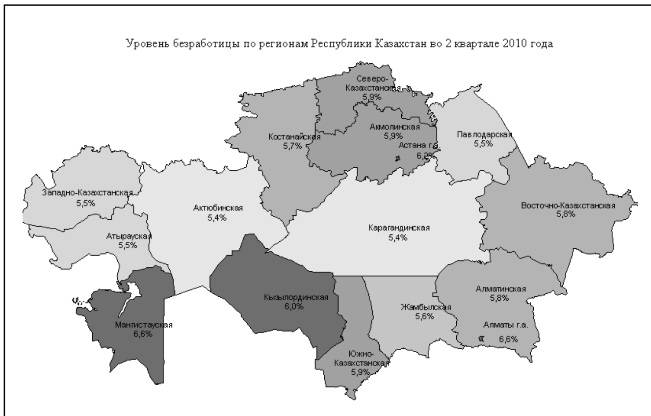
Рисунок 1. Уровень безработицы по регионам Республики Казахстан, II кв. 2010 года [5]