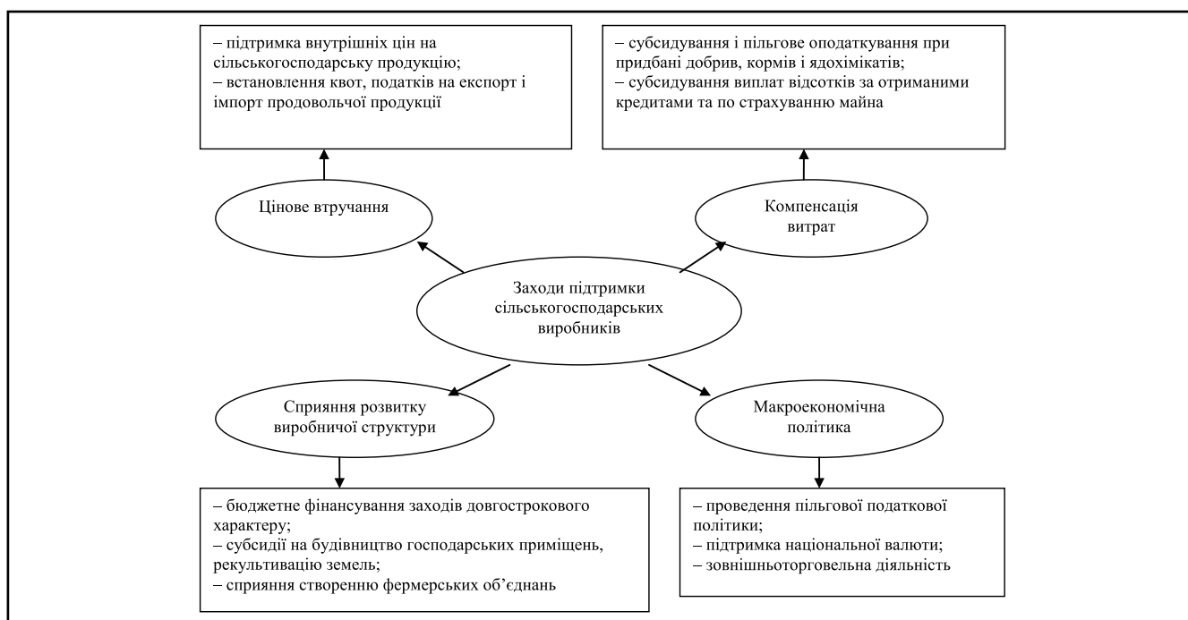
Рисунок 2. Заходи підтримки сільськогосподарських підприємств у розвинених країнах

Окрім державної підтримки малих і середніх підприємств в економічно розвинутих країнах важливим напрямом є сприяння виробництву суспільно значущої продукції, а саме екологічно чистої. Необхідність державної підтримки аграрного сектору в ринковій економіці доведена досвідом західних країн, в яких склалися різноманітні форми, системи і методи цієї підтримки. Її рівень у країнах ЄС і Північної Америки значно вищий, ніж в Україні. Досвід країн засвідчує, що в процесі модернізації економіки пріоритетна роль належала державі. Вона чітко визначала об'єктивно досяжні цілі розвитку, завдання і шляхи їх вирішення, енергійно втручалася в соціально-економічні процеси. Головне місце серед форм протекціонізму в агропромисловому комплексі займають різні механізми підтримки цін на сільськогосподарську продукцію. На них припадає 75% сумарного еквівалента субсидій виробникам у країнах ЄС, 87% – Японії і близько