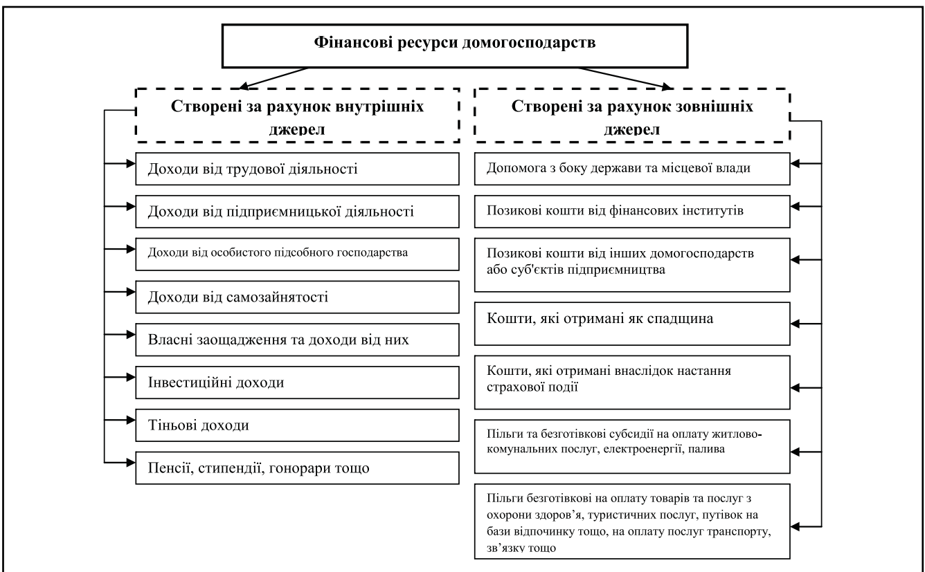
Рисунок 1. Джерела формування фінансових ресурсів домогосподарств

У структурі фінансових ресурсів домогосподарств домінують грошові доходи. Простежується стійка тенденція до їх зростання, лише в 2008 та 2011 роках спостерігається