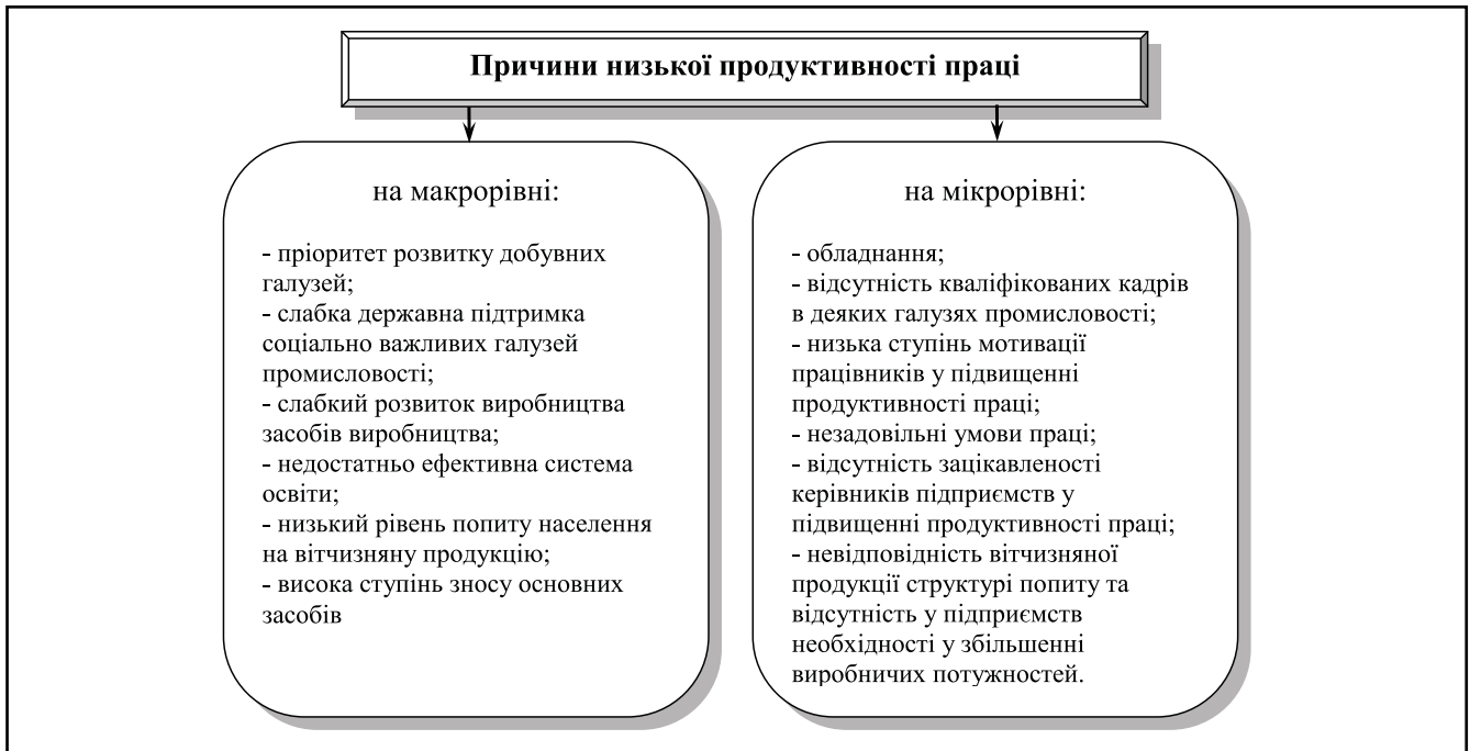
Рисунок 2. Причини низької продуктивності праці в Україні