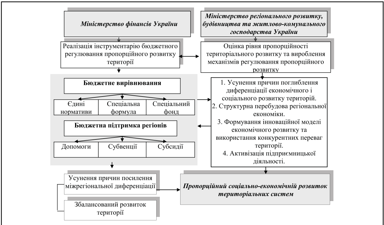
Рисунок 3. Механізм регулювання пропорційного розвитку територій на основі бюджетного вирівнювання та бюджетної підтримки регіонів [складено автором]

дієздатності та результативності місцевих органів виконавчої влади та органів місцевого самоврядування щодо перспектив регіонального розвитку, розв'язання місцевих проблем, усунення різких міжрегіональних диспропорцій явищ; чітке розмежування повноважень між органами виконавчої влади різних рівнів.