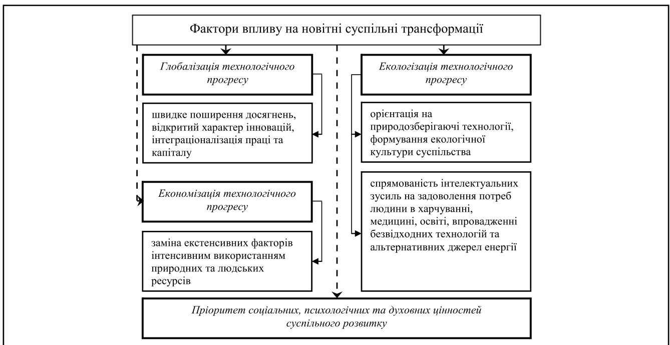
Рисунок 1. Фактори впливу на суспільні трансформації на початку XXI століття [1, с. 8]

У сучасних умовах стрімкого зростання ролі знань та інформації при дослідженні сутнісних характеристик трудового потенціалу варто опиратися на концепції й теорії, що стос-