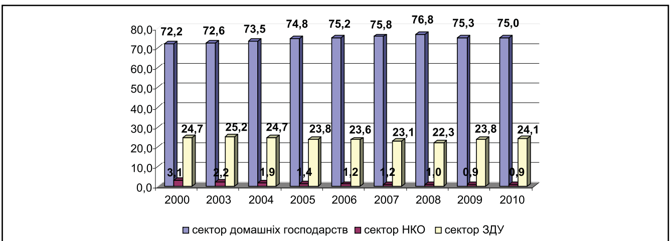
Рисунок 3. Секторна структура кінцевих споживчих витрат, 2000–2010 роки, %

Доходи громадян і підприємств є одним із найважливіших об'єктів державної регуляторної політики, а податки з прибутку підприємств та прибутковий податок із громадян мають бути засобом цього регулювання. Доопрацювання затвердженого Податкового кодексу слід розглядати як першочерговий захід уряду.