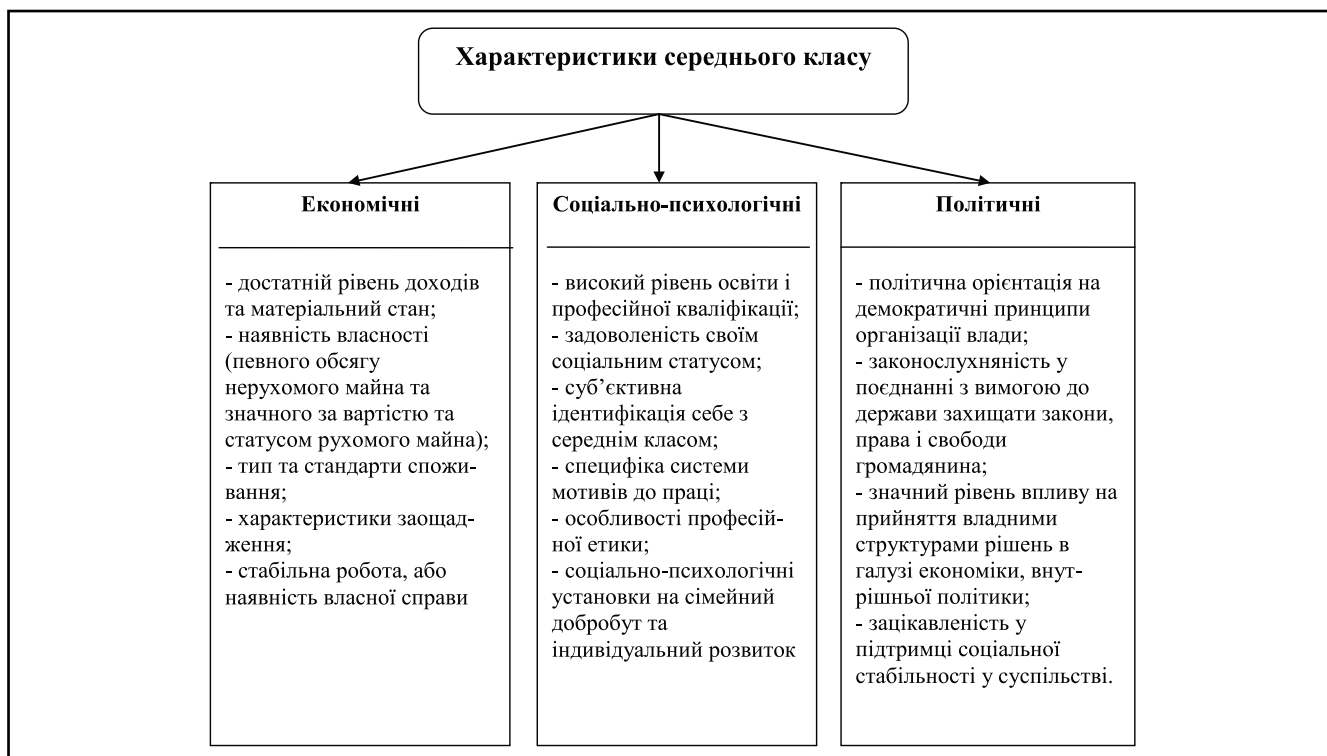
Рисунок 3. Характеристики середнього класу

Висока диференціація населення України за рівнем середньодушових доходів та витрат та високий рівень бідності дають підстави ідентифікувати його як виразно поляризоване. Сформована в ході трансформаційних перетворень соціально-класова структура населення України характеризується незначним (3%) вищим класом, до якого входять елітні та субіелітні групи, і широким (75–80%) нижчим класом [7, с. 180].