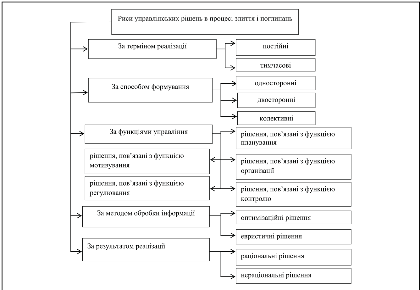
Рисунок 1. Класифікаційні риси управлінських рішень у процесі злиття та поглинання банків