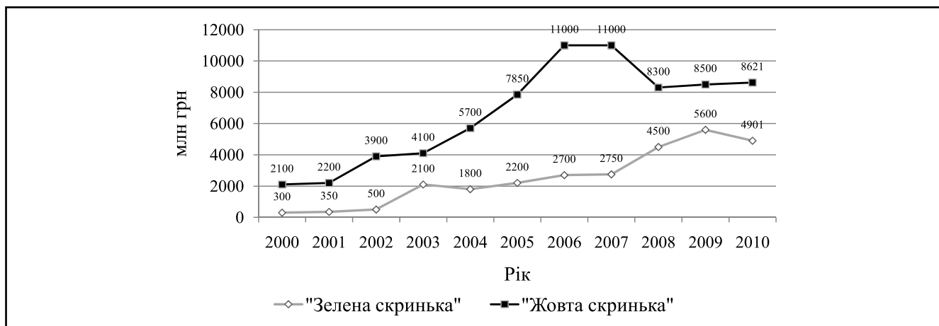
Рисунок 2. Динаміка рівнів державної підтримки сільського господарства України, млн. грн.

ми М.Я. Дем'яненка та Ф.В. Іваниної, для розширеного відтворення та підвищення конкурентоспроможності сільськогосподарської продукції обсяги підтримки сільського господарства мають зрости до 20 млрд. грн. (10 млрд. грн. для досягнення паритетності у міжгалузевому товарообміні плюс 10 млрд. грн. для створення умов забезпечення прибутковості галузі та формування власних фінансових ресурсів, здатних здійснювати розширене відтворення). Враховуючи те, що міжгалузеві диспропорції стали причиною переливання прибутку з сільського господарства у посередницької структури, то державна підтримка має здійснюватися таким чином, щоб фінансові ресурси могли надходити безпосередньо до суб'єктів господарювання [4] і безпосередньо до виробників сільгосппродукції. Через відсталість інфраструктурного забезпечення галузі та посередників останні втрачають майже до половини прибутку.