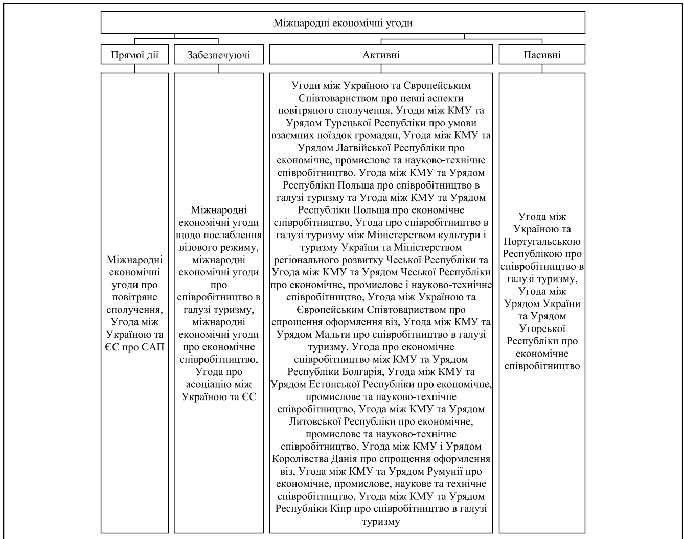
Рисунок 1. Класифікація видів міжнародних економічних угод