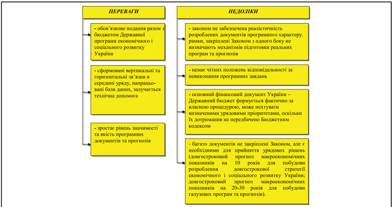
Рисунок 3. Переваги і недоліки існуючої системи прогнозування та розроблення програм економічного і соціального розвитку

енергозбереження та технологічного оновлення наголошувалося в усіх без винятку стратегічних документах. Проте до сьогодні частка проміжного споживання у ВВП, як і раніше, перевищує 50%, а в окремих регіонах – перевищує 80%.