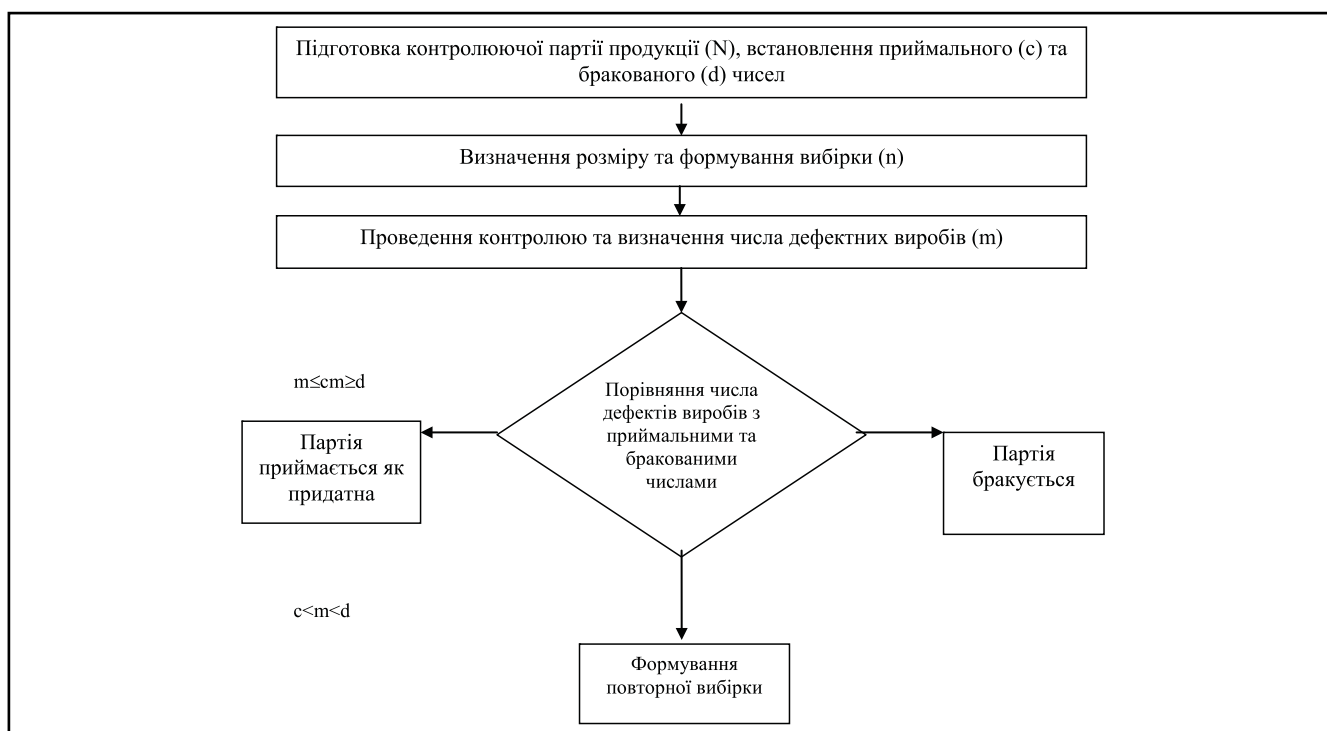
Рисунок 3. Схема багаторівневого приймального контролю якості продукції

ганолептичними та фізико-хімічними показниками на досліджуваних підприємствах під час здачі її виробничими підрозділами на склад або торговельним підприємствам. Статистичний метод контролю заснований на використанні вибіркової перевірки, при якій контролюється тільки відібрана продукція, що дозволяє заощаджувати час та грошові ресурси під час контролю [10, 12]. Вважаємо за доцільне проведення статистичного приймального контролю за альтернативною ознакою, яка буде мати результативність за двома взаємоключними випробуваннями, тобто віднесення продукції до дефектної чи придатної. Послідовність застосування багаторів-