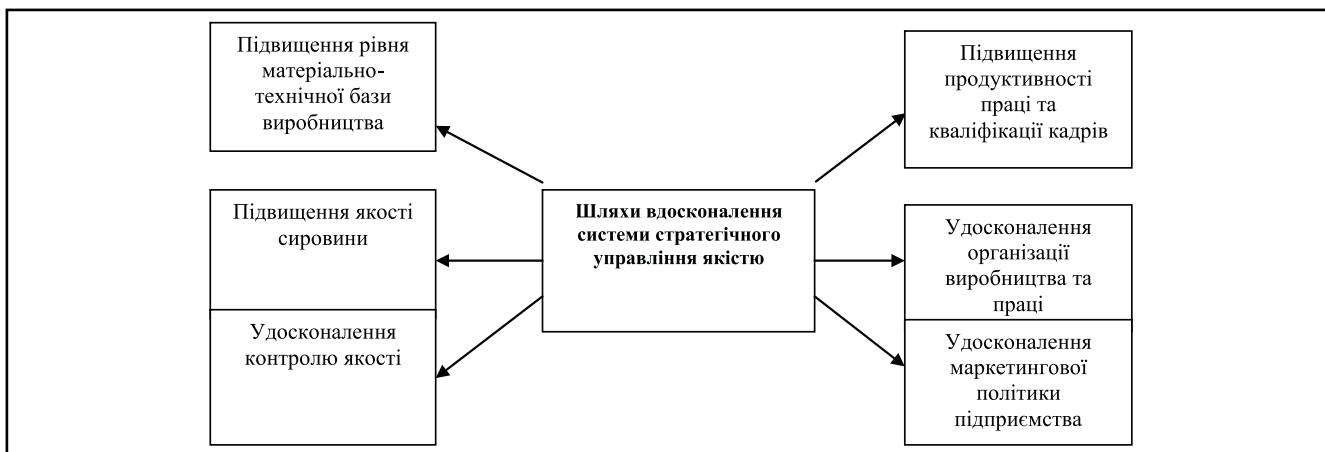
Рисунок 1. Комплекс заходів для вдосконалення системи управління якістю

Аналіз процесу здійснення контролю на досліджуваних підприємствах показав, що вони застосовують такі види