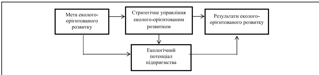
Рисунок 1. Модель стратегічного управління еколого-орієнтованим розвитком підприємства