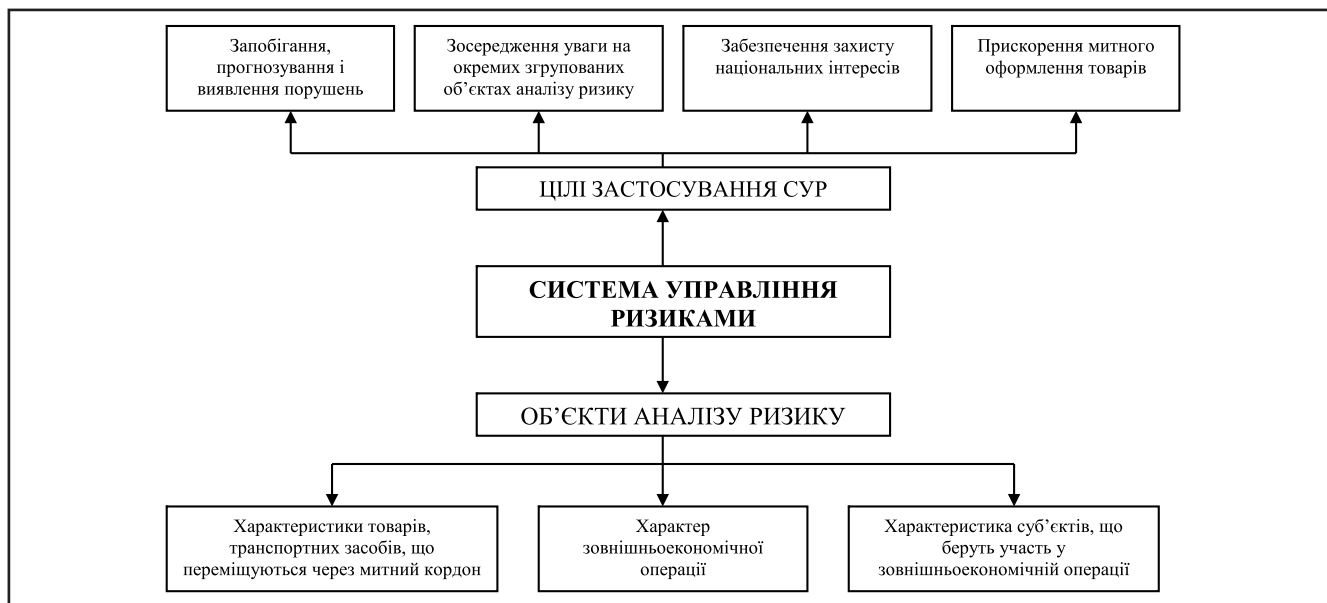
Рисунок 2. Цілі застосування СУР і об'єкти аналізу ризику