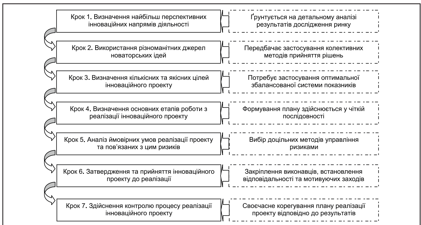
Рисунок 1. Етапи результативного управління інноваційною діяльністю підприємства

З метою забезпечення ефективності даного процесу на вітчизняних підприємствах мають створюватися відповідні системи реалізації зазначених функцій, тобто необхідно приділяти окрему увагу формуванню ефективного механізму управління інноваційною діяльністю теоретичного та практичного характеру. Слід зазначити, що інноваційна діяльність у повному обсязі має комплексний, системний ха-