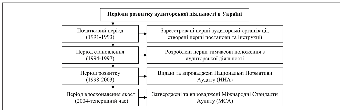
Рисунок 1. Періоди розвитку аудиторської діяльності в Україні

На початку розвитку аудиторської діяльності в Україні було створено Спілку аудиторів України (САУ). У своїй діяльності САУ керується статутом, прийнятим з'їздом аудиторів України 14.02.92. САУ має територіальні відділення у всіх облас-