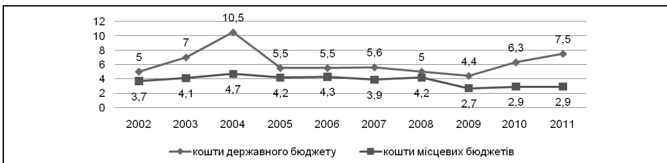
Рисунок 2. Частка державного та місцевих бюджетів у структурі фінансування інвестицій в основний капітал, %*