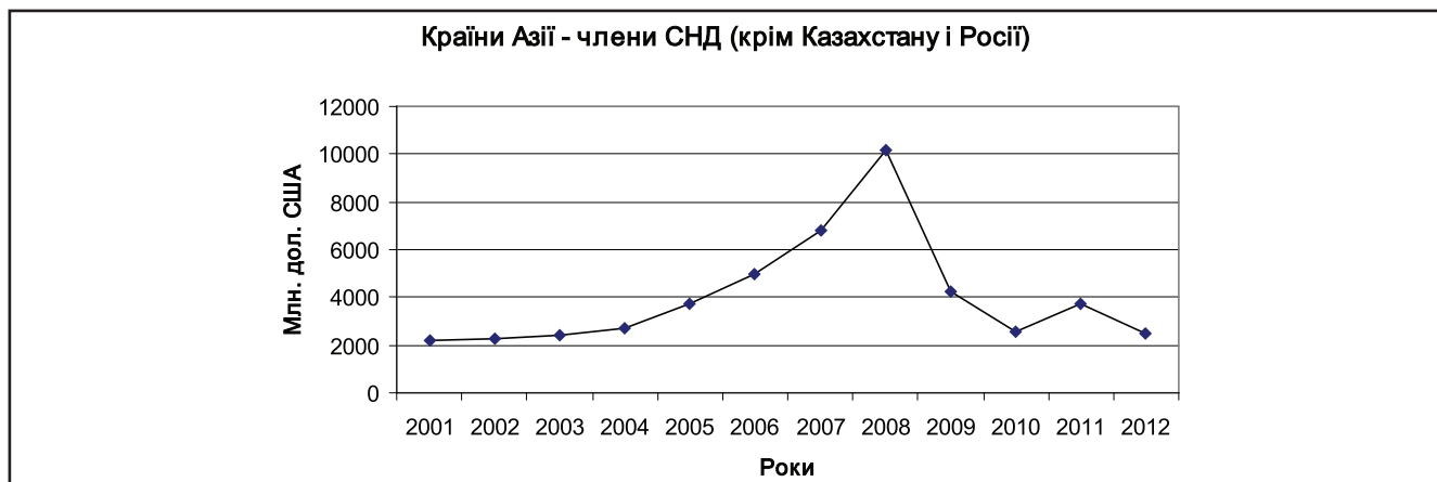
Рисунок 1. Динаміка товарообігу України з азіатськими країнами – членами СНД (крім Казахстану і Росії)

Тренд: y_{\text{Asian CIS countries}} = 161,05x + 2985,5 .