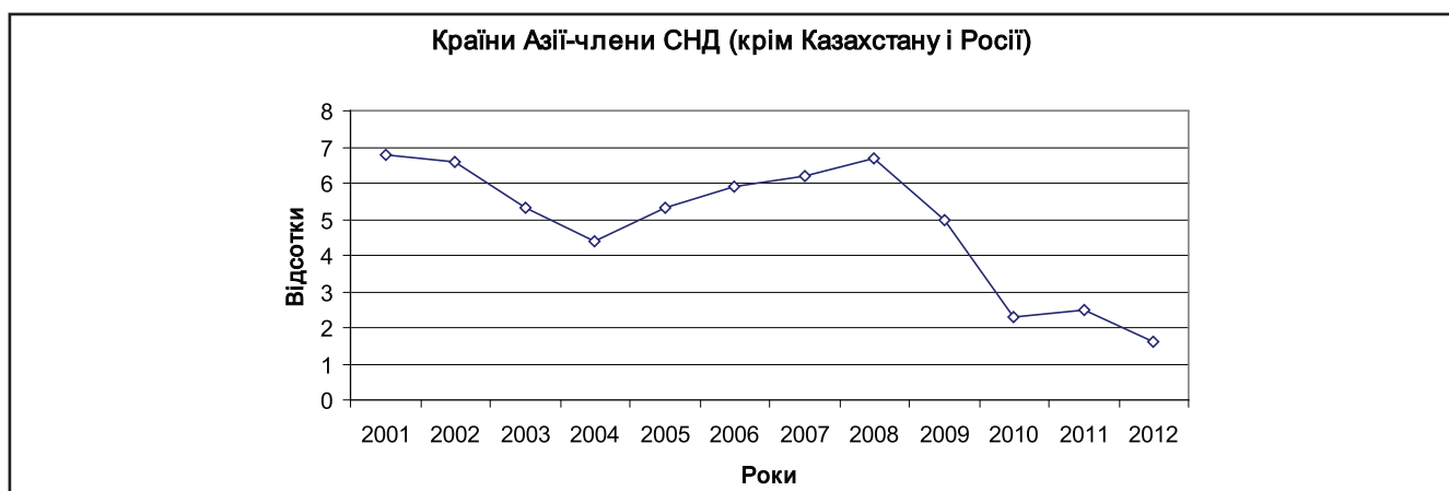
Рисунок 2. Динаміка питомої ваги товарообігу України з азіатськими країнами – членами СНД (крім Казахстану і Росії) у всьому її товарообігу

Тренд: y_{\text{Asian CIS countries}} = -0,3762x + 7,3288 .