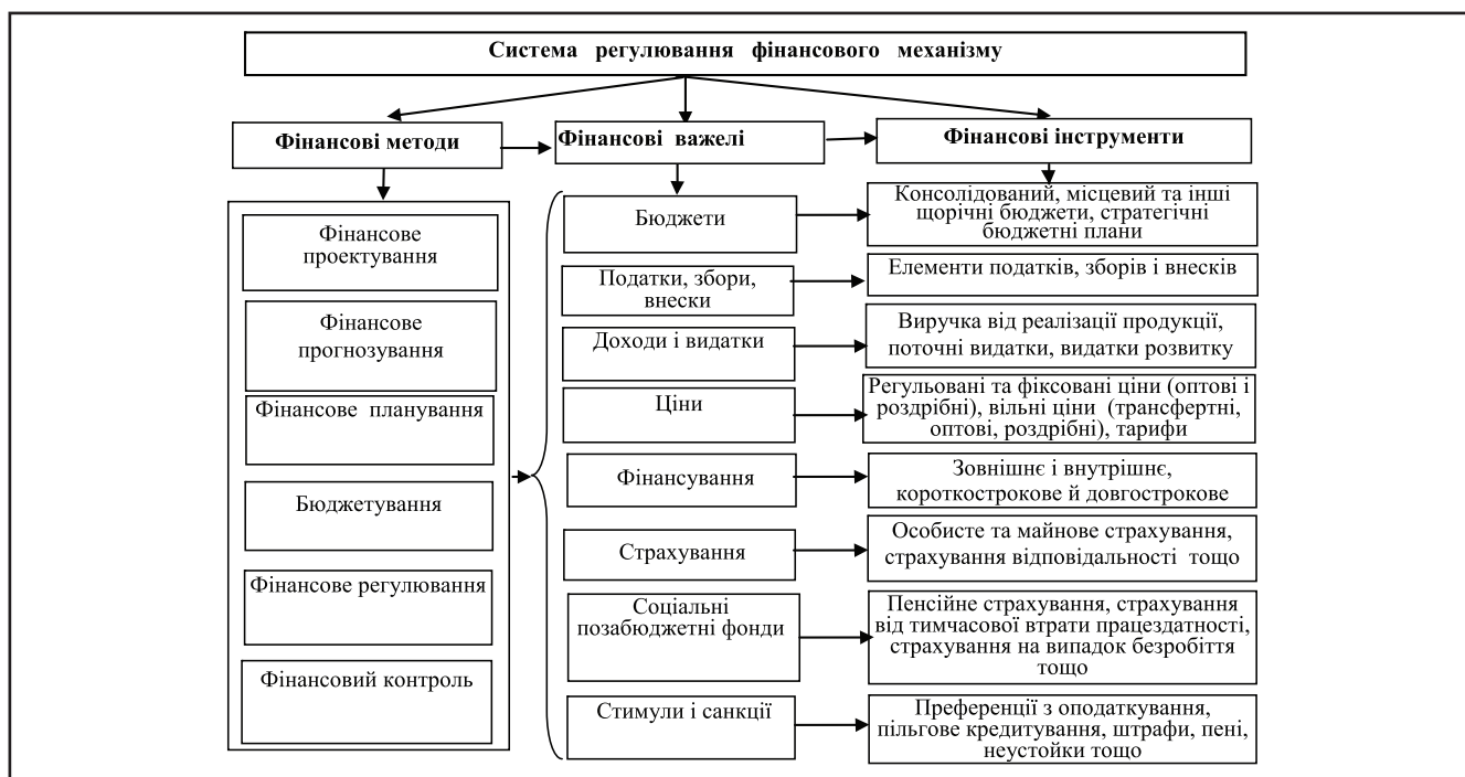
Рисунок 2. Система регулювання фінансового механізму та взаємозв'язок його елементів

В Україні діє механізм недостатньо економічно обґрунтованого підвищення життєвого рівня населення. Якщо порівнюва-