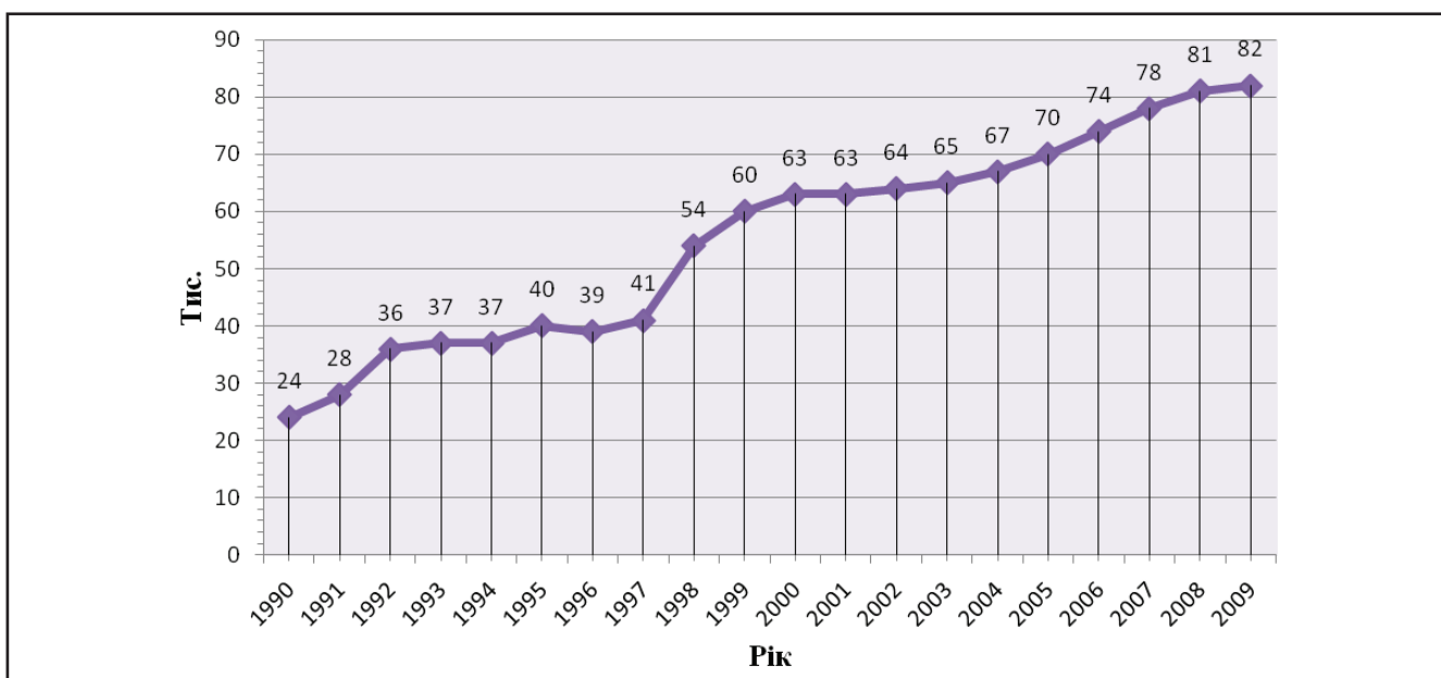
Рисунок 1. Динаміка кількості ТНК у світі

За останні тридцять років кількість ТНК збільшилася у дев'ять разів (у 1970 році було зареєстровано 7 тис. таких фірм, у 1976 році їхня кількість становила 11 тис. із 86 тис. зарубіжних філій, а у 1990 році – 24 тис. ТНК). У середині 90-х років функціонувало 40 тис. таких корпорацій, які контролювали за межами своїх країн до 250 тис. дочірніх компаній. Останні офіційні дані щодо кількості ТНК у світі опубліковані у Звіті про світові інвестиції ЮНТАД за 2010 рік – у світі налічується 82 тис. транснаціональних корпорацій та їх 810 тис. зарубіжних підрозділів (рис. 1) [20]. Варто зазначити, що має місце тенденція зростання чисельності працівників, яка становила в