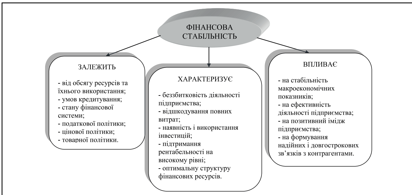
Рисунок 2. Характеристика фінансової стабільності