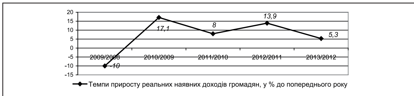
Рисунок 2. Динаміка приросту реальних доходів громадян у 2008–2013 роках, %*

На основі проведеного аналізу нами виявлено нерівномірну тенденцію у зростанні середньої заробітної плати та прирості реальних доходів громадян. Зростання реальних доходів значно повільнішими темпами, ніж зростання середньої