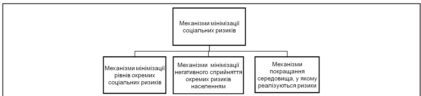
Рисунок 3. Диференціація механізмів мінімізації соціальних ризиків