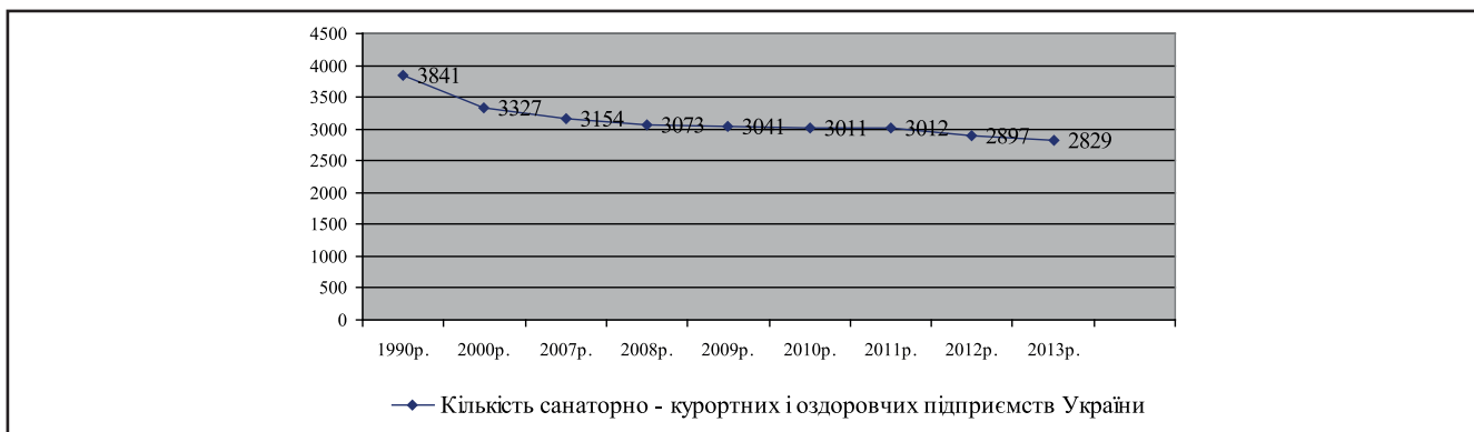
Рисунок 1. Динаміка зміни санаторно-курортних і оздоровчих закладів України за 1990–2013 роки [2; 3, с. 455]