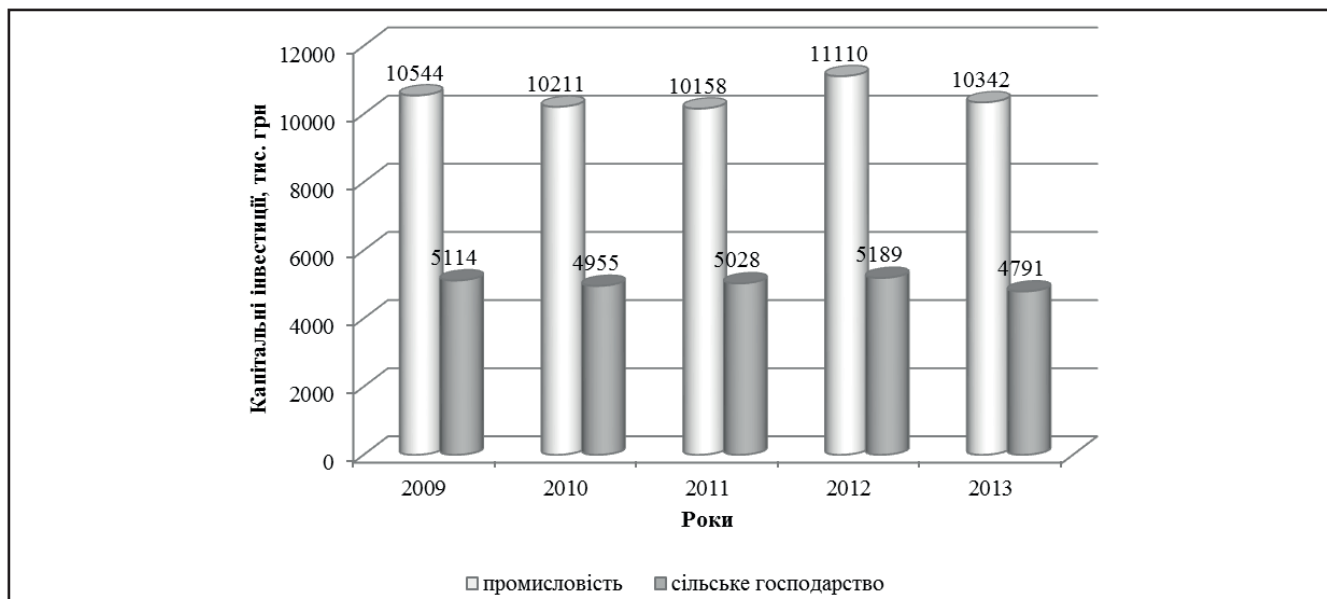
Рисунок 1. Динаміка обсягів капітальних інвестицій виробничого комплексу кримінально-виконавчої системи України у 2009–2013 роках, %