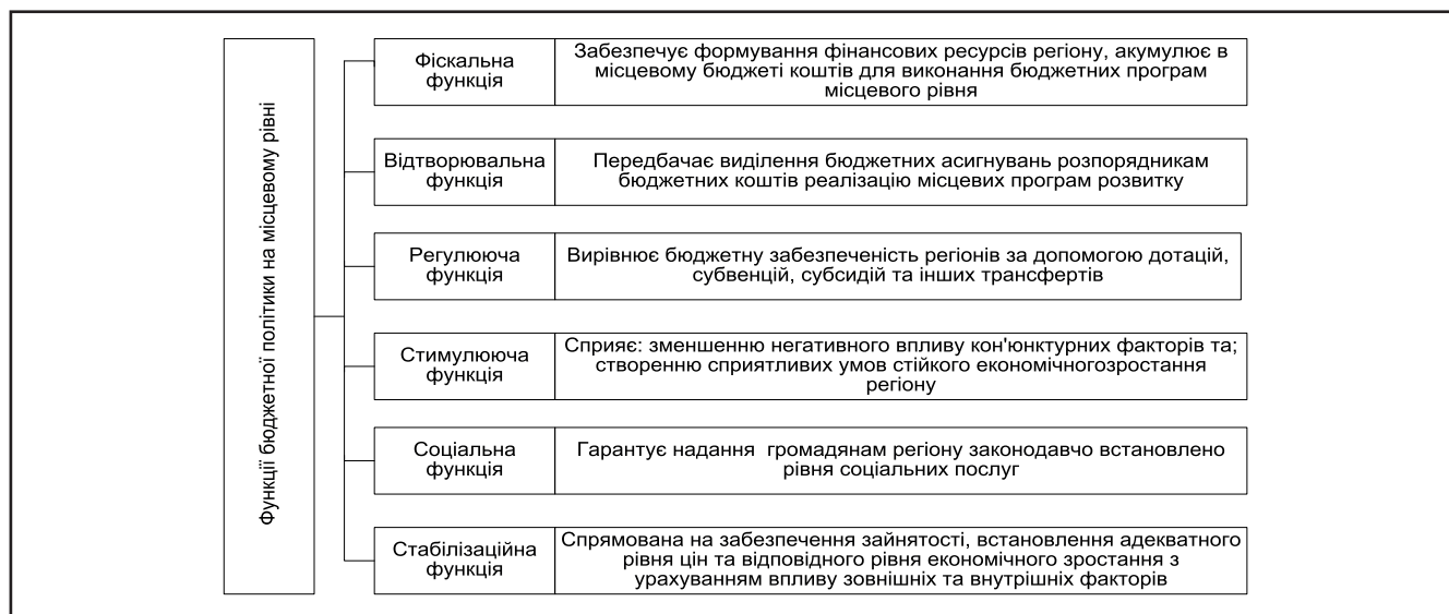
Рисунок 1. Функції бюджетної політики на місцевому рівні

На основі отриманих результатів дослідження нами запропоновано алгоритм, що враховує концептуальні основи реалізації