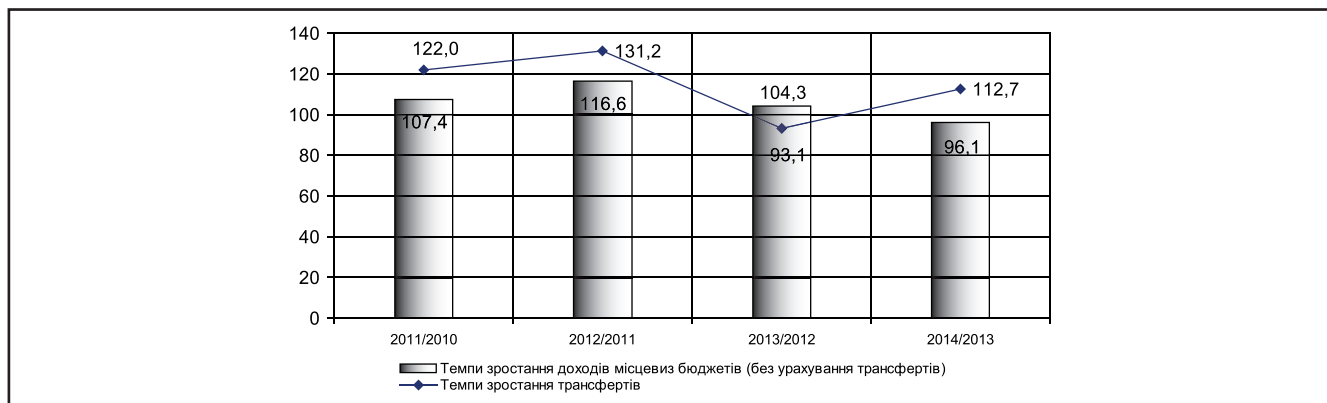
Рисунок 2. Темпи зростання трансфертів та доходів місцевих бюджетів за 2010–2014 роки, % [2]

Розраховано автором на основі даних: http://www.ibser.org.ua/UserFiles/File/Monitoring%20Quarter%202014/ukr