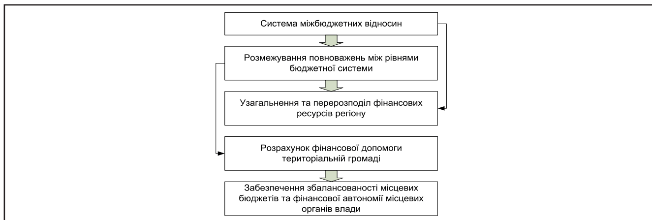
Рисунок 2. Система міжбюджетних відносин

додаткового залучення фінансових ресурсів та використання прихованих резервів на місцях.