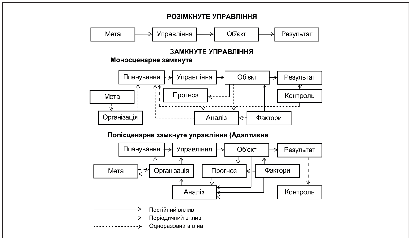
Рисунок 3. Типи управління в економіці та їх структура