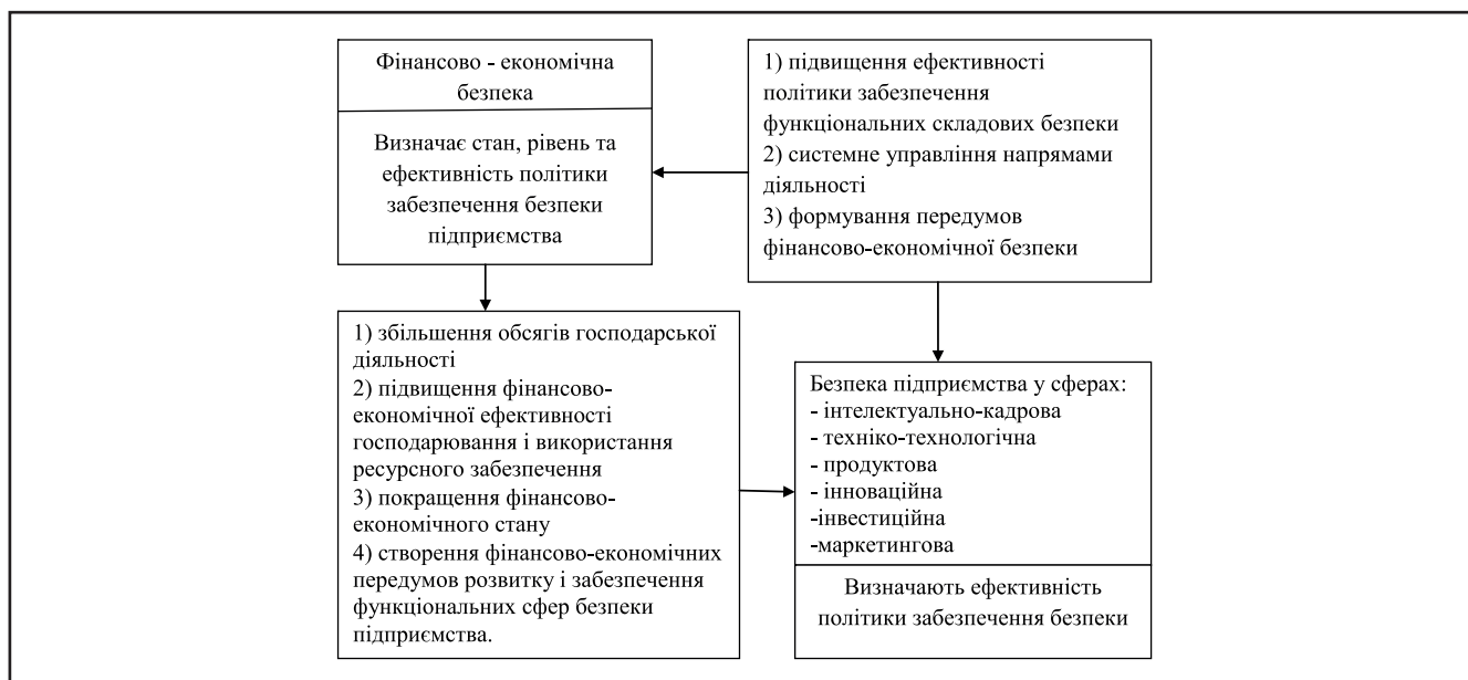
Рисунок 1. Взаємозалежність фінансової та інших складових безпеки підприємства

Точне оцінювання загроз фінансово-економічній безпеці підприємства, розроблення та реалізація методів нейтралізації негативного впливу цих загроз вимагають побудови адекватного механізму управління фінансово-економічною безпекою. Під управлінням фінансово-економічною безпекою підприємства розуміють систему принципів і методів розроблення та реалізації управлінських рішень, які пов'язані із забезпеченням захисту його пріоритетних фінансово-економічних інтересів від внутрішніх і зовнішніх загроз.