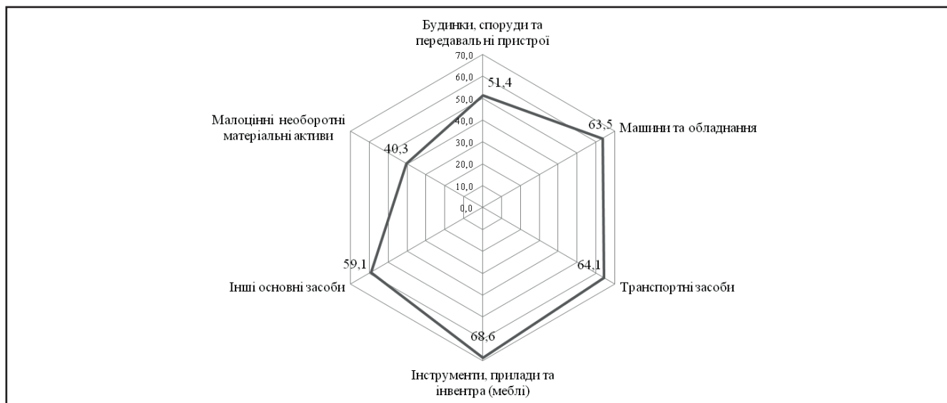
Рисунок 3. Рівень зносу окремих елементів основних засобів державних підприємств УВП Харківської області у 2013 році (станом на кінець року), %