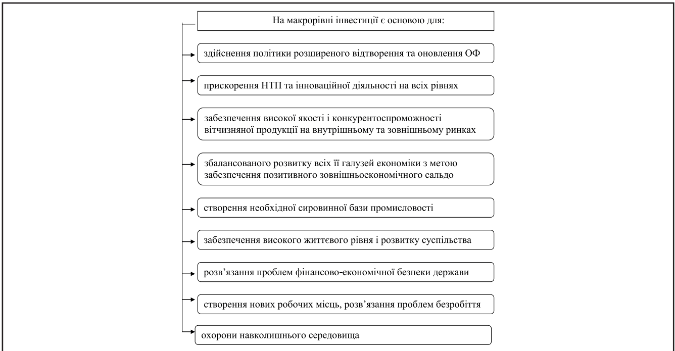
Рисунок 1. Вплив інвестицій на макрорівні